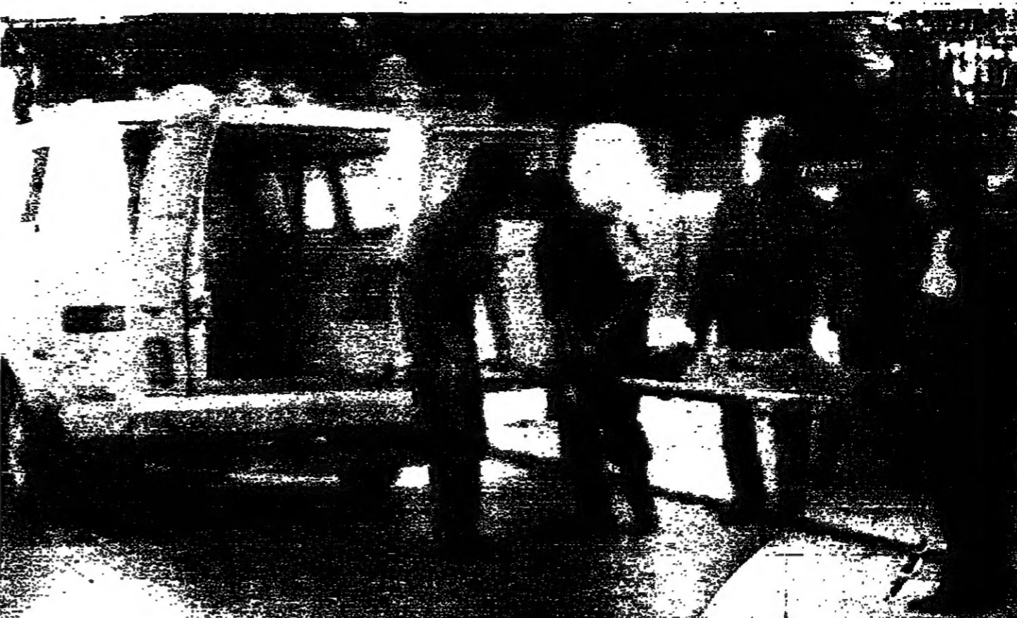
جثة أحد الضحايا في طريقها إلى سيارة الإسعاف

تحت حدة الاشتباكات في بيروت، واهي أمس بعد الاتفاق على إطلاق النار - وتحسن الموقف - وانخفضت كثافة تبادل النيران - قلت نسيم من وقت لآخر حتى في مناطق التوتر، كما أدى السعي من الضحايا.